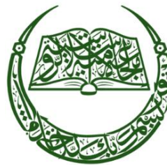
Российский исламский институт